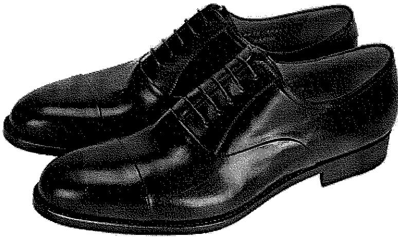
黑色素面皮鞋(男生)